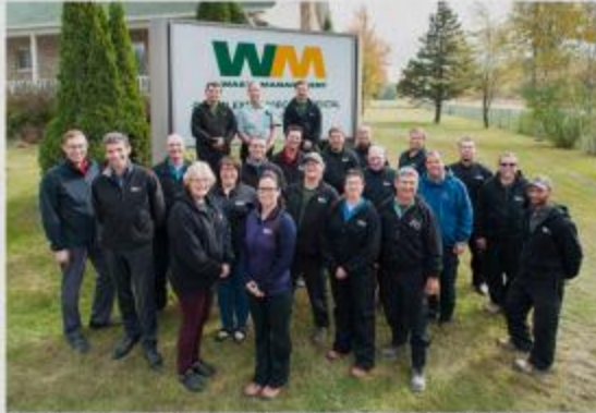
Les employés de Waste Management possèdent en moyenne une ancienneté de 12 ans.

Au tournant de l'an 2000, WM a pris un virage important en matière de santé et de sécurité au travail en implantant le programme «Tolérance zéro» à travers toute la compagnie en Amérique du Nord. Ce programme, axé sur de la formation en prévention, ne laisse place à aucun comportement à risque qui pourrait mettre en danger un travailleur. Loin de résister au changement, l'équipe de Drummondville a rapidement intégré les nouvelles pratiques dans ses habitudes de travail qui sont aujourd'hui des réflexes naturels, explique l'entreprise, par voie de communiqué.